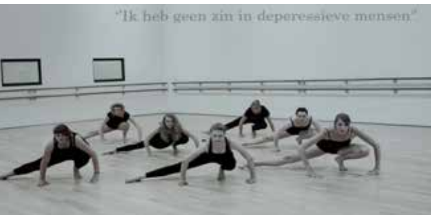
1. Dans: een uitlaatklep en een mogelijkheid om de balans te vinden.