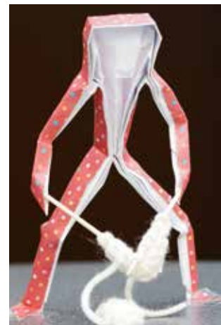
3. Origami met een zelf ontwikkelde breitechniek.

op zichzelf, en niet alleen een middel om andere doelen te bereiken. Eigen regie is dus niet hetzelfde als keuzes maken en/of regelen wat noodzakelijk is. De betekenis van wat iemand wil is veel breder dan de betekenis van wat iemand met eigen kracht kan regelen en realiseren, en breder dan de betekenis van eigen verantwoordelijkheid.