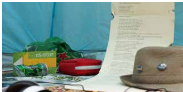
2. Op Lowlands kun je jezelf verliezen zonder jezelf kwijt te raken.