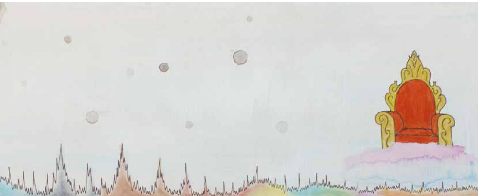
6. Een tijdslijn met aan het eind een troon die de eigen regie symboliseert.

participatie anderzijds, en hoe deze elkaar beïnvloeden, was de tekst van deze nieuwe competentie voor ons mede aanleiding om het begrip eigen regie verder te onderzoeken.