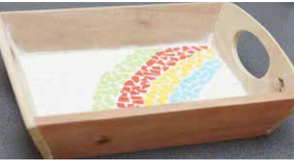
4. Vier kleuren van de regenboog: de eigen regie op een presenteerblaadje.