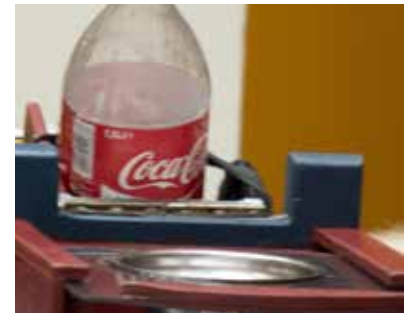
7. Een schenkapparaat waarmee de gebruiker kan bepalen wanneer en hoe veel hij drinkt.