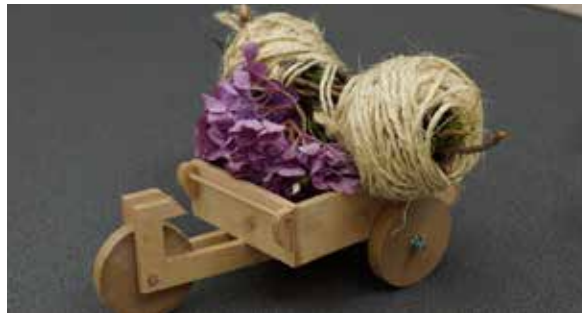
5. Karretje met halter toont de mobiliteit van eigen regie.